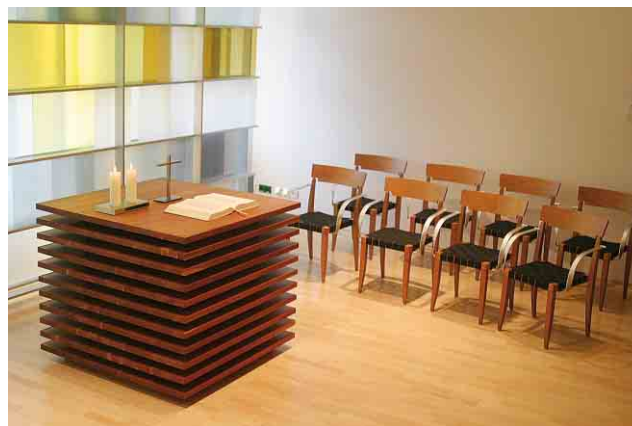
Andachtsraum der Universitäts-Frauenklinik Tübingen

Der Andachtsraum der Klinik auf Ebene 4 steht Ihnen als Raum der Stille zur Verfügung – hier können Sie verweilen, hierher können Sie Ihre Trauer tragen und ein Licht für Ihr Kind anzünden.