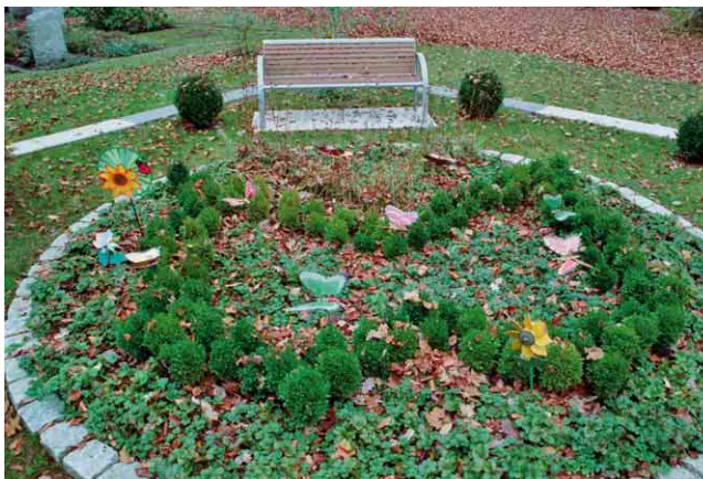
Kindergrabanlage Schmetterling auf dem Bergfriedhof Tübingen